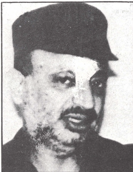
Arafat: símbolo de un pueblo perseguido.

La indignación de todos los pueblos del mundo no ha sido suficiente como para movilizar a los gobiernos contra esta agresión. En Europa, Bruno Kreisky ha denunciado no sólo el terrorismo genocida de Begin y Sharon, sino también la complicidad del Partido Laborista Israelí, y solicitado su expulsión de la Internacional Socialista. Entre tanto, sólo los palestinos continúan resistiendo, defendiendo el Beyruth de los pobres, porque el de los ricos, ese no ha sido bombardeado. Allí residen los cómplices de la invasión, los que sugieren que "hay que matar a todos los palestinos, incluidos los niños".