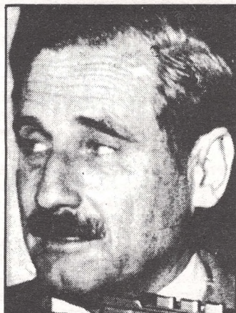
Dictador Alvarez: continuismo a tope.

● Contradiciendo su increíble afirmación de 1981, el Ministro Arismendi, al explicar el nuevo paquete económico anti-popular, que resumimos en nuestra edición anterior, dijo que el país "no escapa a la recesión internacional, porque no es una isla", defendiendo la política económica más desastrosa que registra nuestra historia. Una revista especializada: "Crónicas Económicas", que no es opositora, comentando el paquete Arismendi, sostuvo que eran "un conjunto de disposiciones fiscales que no atacaban los problemas de fondo", meros analgésicos para un enfermo muy grave. Y agregaba que a pesar de los vaticinios triunfalistas de 1981 sobre la baja de los intereses "en 45 días", hoy la tasa se sitúa "alrededor del 60 %".