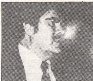
Alberto Fuentes Mohr; Martir del socialismo guatemalteco

3. El PSD, que no es un partido más sino un real instrumento liberador, plantea la lucha política democrática contra el actual régimen.